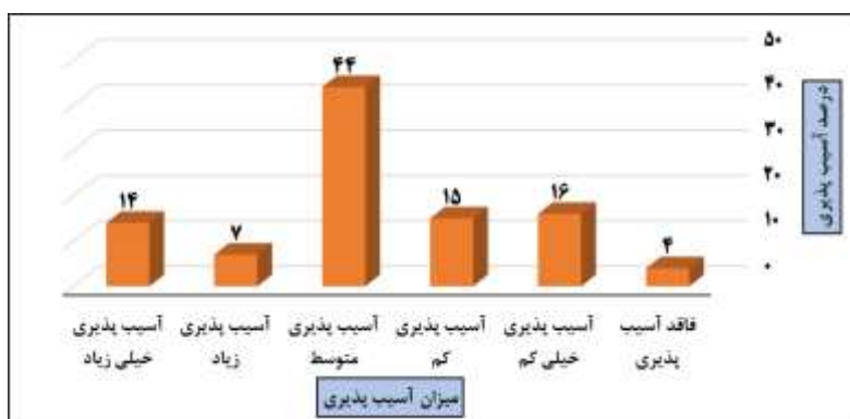
شکل ۲- درصد آسیب پذیری کلی بافت فرسوده مورد مطالعه

با توجه به نتایج حاصل از مطالعه شاخص‌ها، زیر شاخص‌ها و درجه‌بندی آن‌ها بر اساس میزان آسیب پذیری، ۴ درصد بافت فرسوده مورد مطالعه فاقد آسیب پذیری، ۱۶ درصد با آسیب پذیری خیلی کم، ۱۵ درصد با آسیب پذیری کم، ۱۴ درصد با آسیب پذیری متوسط، ۷ درصد با آسیب پذیری زیاد و ۴ درصد با آسیب پذیری خیلی زیاد می‌باشد.