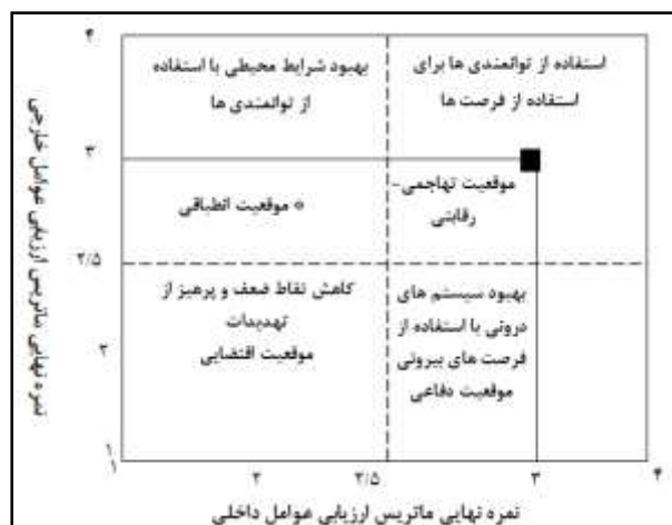
شکل ۳- موقعیت بافت فرسوده در ماتریس داخلی - خارجی