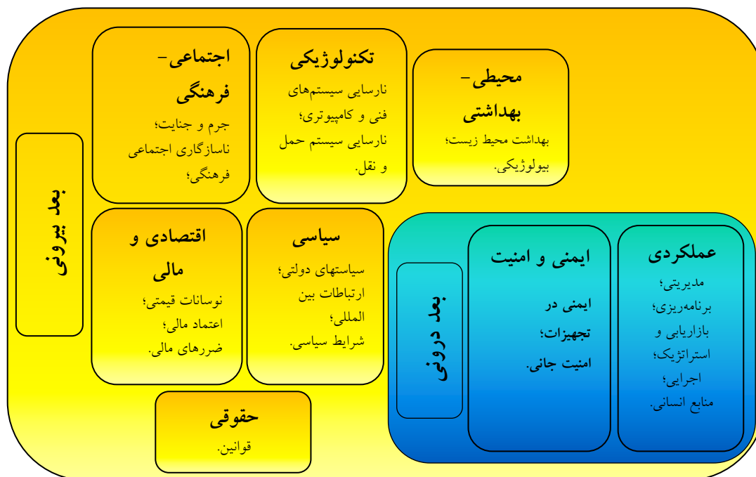
شکل ۳ ابعاد، مؤلفه‌ها و معیارهای پژوهش