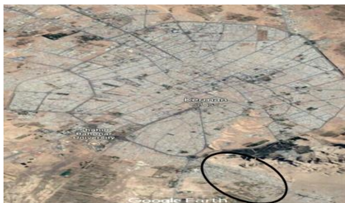
شکل ۲- شهر کرمان و محله سرآسیاب

شهر کرمان به لحاظ نسبی بودن خطر زلزله نیز در سطح بسیار زیاد درجه‌بندی شده است (کمیت‌ه دائمی بازنگری آیین‌نامه طراحی ساختمان‌ها در برابر زلزله، ۱۳۹۳) و همچنین از جمله شهرها و مناطق با تراکم جمعیت بالا محسوب می‌شود که بافت‌های فرسوده، فرهنگ سنتی ساختمان‌سازی، عدم توجه کافی به مقوله طراحی در برابر زلزله، عوامل فرهنگی، عدم آمادگی مردم در برابر زلزله و بسیاری از عوامل دیگر دست‌به‌دست هم داده‌اند تا این شهر با ظرفیت خطرپذیری بالایی قلمداد گردد. علاوه بر این، در بین محلاتی که مرکز مطالعات مدیریت بحران شهر کرمان کلاس‌های آموزشی برگزار نموده است، محله سرآسیاب دارای سازه‌های غیرمقاوم با بافت سنتی و همچنین از جمله محلات حاشیه‌نشین شهر کرمان محسوب می‌شود. علاوه بر این ساکنین محله سرآسیاب به دلیل اینکه نسبت به سایر محلات، استقبال بیشتری داشته‌اند به‌عنوان محله مورد نظر در انجام این تحقیق انتخاب شده است.