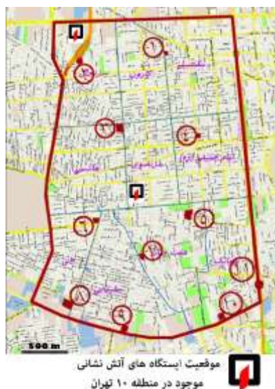
شکل ۳- موقعیت ایستگاه‌های پیشنهادی و ایستگاه‌های موجود در منطقه ۱۰ تهران

جدول (۱) مشخصات و محل استقرار ایستگاه‌های پیشنهادی را ارائه می‌دهد.